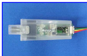
CPU 内蔵クランプセンサー