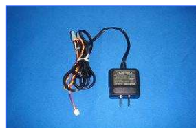
専用 AC アダプター (40 台迄接続可能)