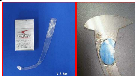
北電子現行筐体クレマン